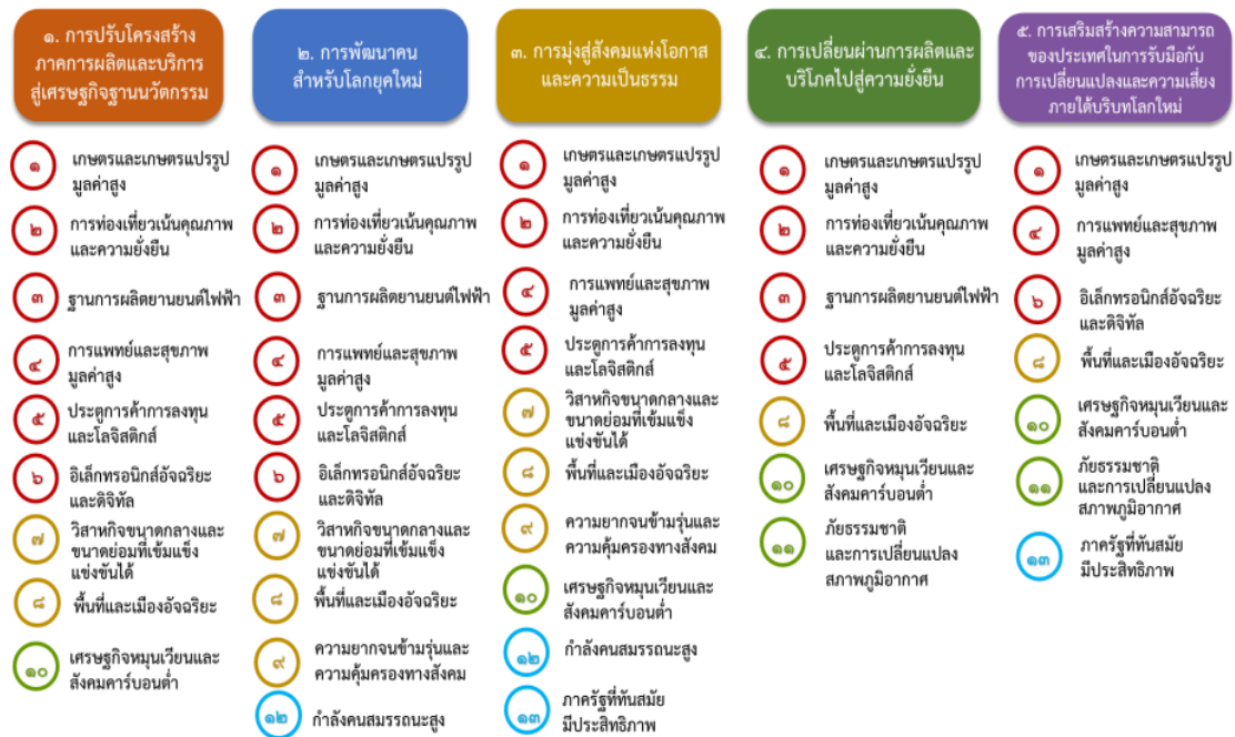
แผนภาพที่ ๓.๑ ความเชื่อมโยงระหว่างหมวดหมู่การพัฒนา กับเป้าหมายหลัก

ความเชื่อมโยงระหว่างหมวดหมู่การพัฒนา กับเป้าหมายหลักแสดงไว้ในแผนภาพที่ ๓.๑ โดยหมวดหมู่การพัฒนาที่กำหนดขึ้นเป็นประเด็นที่มีลักษณะเชิงบูรณาการที่ครอบคลุมการพัฒนาตั้งแต่ในระดับต้นน้ำจนถึงปลายน้ำ และสามารถนำไปสู่ผลพัฒนาทั้งในมิติเศรษฐกิจ สังคม ทรัพยากรธรรมชาติและสิ่งแวดล้อมไปพร้อมๆ กัน ทำให้หมวดหมู่แต่ละประการสามารถสนับสนุนเป้าหมายหลักได้มากกว่าหนึ่งข้อ นอกจากนี้การพัฒนาภายใต้แต่ละหมวดหมู่ไม่ได้แยกขาดจากกัน แต่มีการสนับสนุนหรือเอื้อประโยชน์ซึ่งกันและกัน